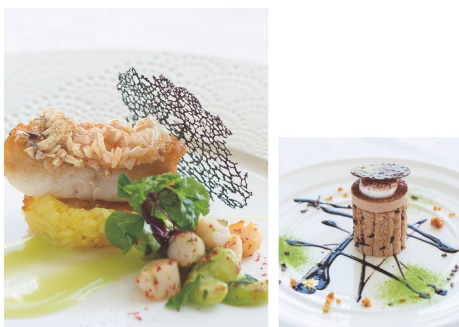
エリスリーナ西原ヒルズガーデンはふたりとゲストの皆様が過ごす特別な時間に寄り添い最高なおもてなしの一品を感動とともに提供します。

ふたりはもちろんゲストにとっても特別な1日。だからこそ【一生忘れられない味で感動】【笑顔になれる料理】創造する。ふたりの生まれ育った郷土食材や料理、想い出深い料理などことん拘った世界にひとつだけのオリジナルメニューも人気。ふたりの想いを料理で表現し、一皿一皿心を込めてゲストへお届けする。