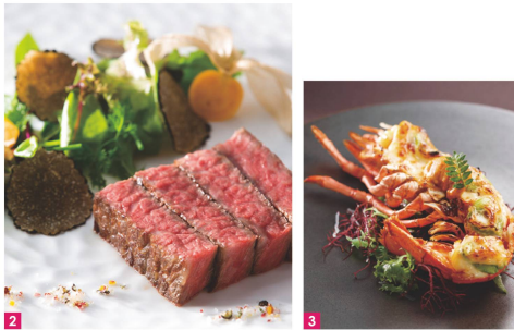
1 素材そのものの繊細な味、温度や香り、美しさ、そのすべてを詰め込んだ和テイストのメニュー。2 シェフ自慢の国産牛を焼き加減にもこだわった一品。3 新鮮な素材を活かし彩鮮やかな料理はテーブルを華やかに。

経験を積んだシェフが地元の旬の食材を活かして作り上げる料理は五感を唸らす最高のおもてなし。できたての料理を、オープンキッチンから全てのゲストへ届け、ベストタイムで提供する。